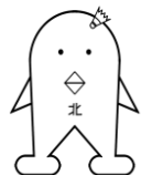
キタリーナちゃん